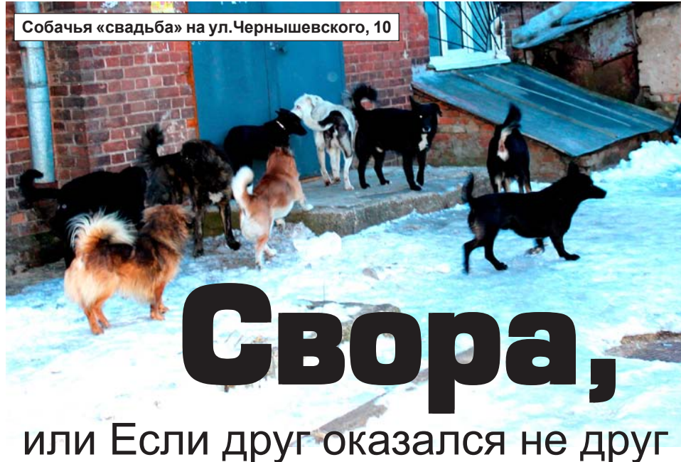
Собачья «свадьба» на ул. Чернышевского, 10

Защитники животных утверждают, что сократить численность бродячих собак можно путем стерилизации животных, особенно это касается женских особей. Но нигде в мировой практике этим не занимаются по простой причине. У стерилизованных сук из всего комплекса поведения выпадает лишь половая составляющая, при этом защита территории только усиливается. Охранять место обитания такая собака будет с двойной силой как от человека, так и от хозяйских собак.